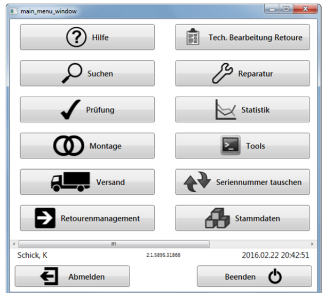
Abb.2: Einbindung in das FG-Traceability-System

Nachgelagerte Auswertungstools sowie die Integration in das FG-eigene Traceability-System ermöglichen die Analyse und Dokumentation der Gerätehistorie.